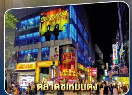
ตลาดซีเหมินตง