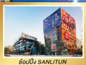
ช้อปปิ้ง SANLITUN