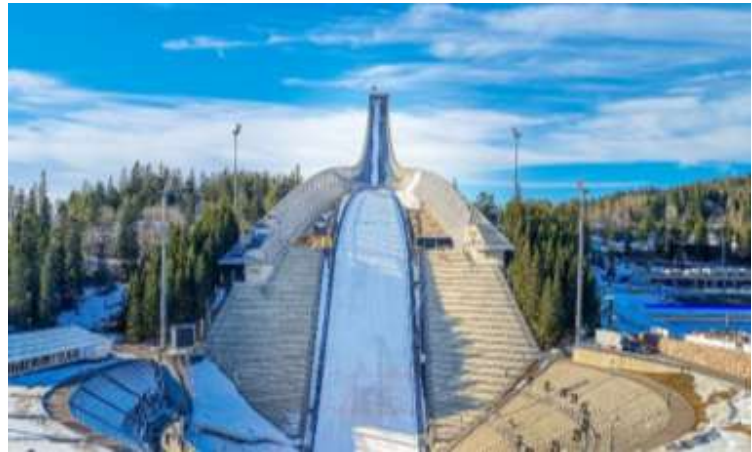
HOLMENKOLLEN SKI JUMP