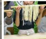
กิจกรรมทำเส้นอุด้ง