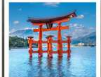
ศาลเจ้าอิตสึคุชิมะ