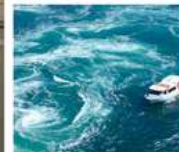
คลองเรือขมบ้านนาสุโตะ

คลองเรือขมบ้านนาสุโตะ / ซุปบึงย่านชินโซบาช / ตลาดปลาคุโรเมง / ซุปบึงย่านอุมาเดะ