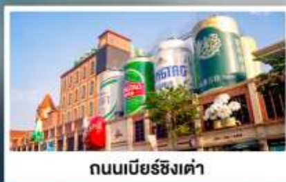
ถนนเบียร์ชิงเต่า