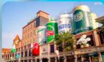
ถนนเบียร์ชิงเต่า