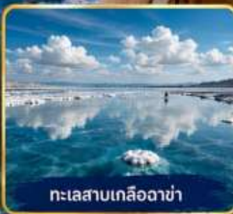
ทะเลสาบเกลือฉาง่า