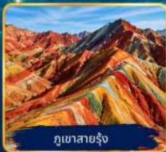
ภูเขาสายรุ้ง