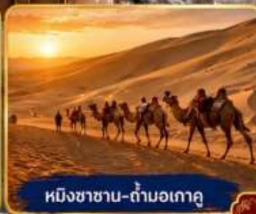
หมิงซาซาน-ถ้ำมอเกา