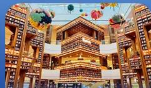
ห้องสมุดคSTARพีค