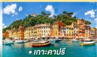
• เกาะคาปรี