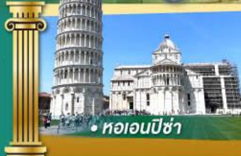
• ทอออนปิซ่า