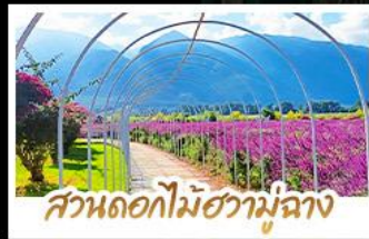
สวนดอกไม้ฮามูฉาง