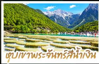
เขุบเขาพระจันทร์สีน้ำเงิน