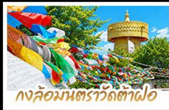
วงล้อมนตราวัดต้าฝอ

ถ่ายรูป MOOD ที่ใช้กันวิวทะเลสาบเอ๋อร์ไห่สุดโรแมนติก • ชมดอกไม้ตามฤดูกาลกลางขุนเขา ณ สวนอวามูฉาง พิศดูภูเขาหิมะมังกรหยกความสูงกว่า 4,506 เมตร (รวมกระเช้าใหญ่ไป-กลับ) • นั่งรถไฟชมวิวภูเขาหิมะมังกรหยก ชนวิญแบบพาโนรามา • เที่ยวเมืองโบราณต้าหลี่ ลี้เจียง แซงกรี่ล่า ซิม ซือป แซะ กับวัดมณฑลยูนนานกิบเบต ชมธารน้ำขาวไปสู้อยู่ UNSEEN เมืองจันหนังยูนนาน • วัดลามะซังจ้านหลิน สัมผัสกลิ่นอายอารยธรรมทิเบต ช้อปปิ้งกับล๊อมมตราที่ใหญ่ที่สุดในจีน • ซุปปิงเฟลิม ณ ถนนคนเดินหนานมิงเจีย & POP MART