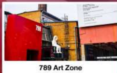
789 Art Zone