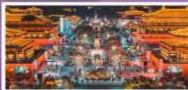
ถนนวัฒนธรรมราชวงศ์ถัง