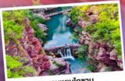
อุทยานหยูมโตซาน