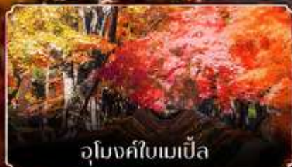
อุโมงค์ไเบเมเปิ้ล