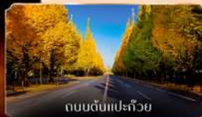
ถนนต้นแปะทิว