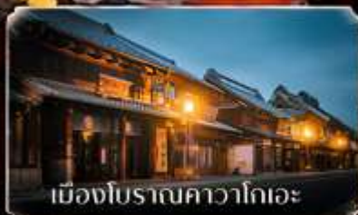
เมืองโบราณคาวาโกเอะ