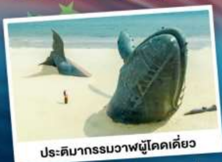
ประติมากรรมวาฬโคดเคียว