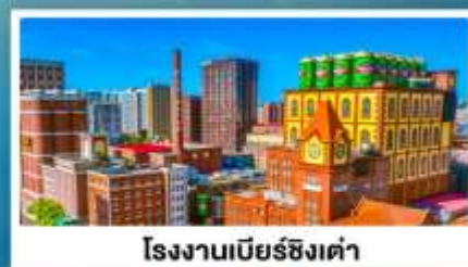
โรงงานเบียร์ซิงเต่า