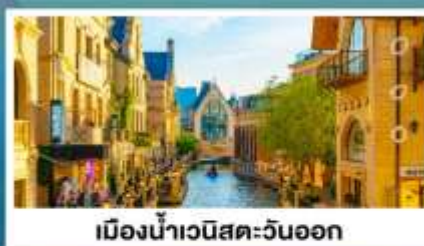
เมืองน้ำเวนิสตะวันออก