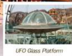
UFO Glass Platform