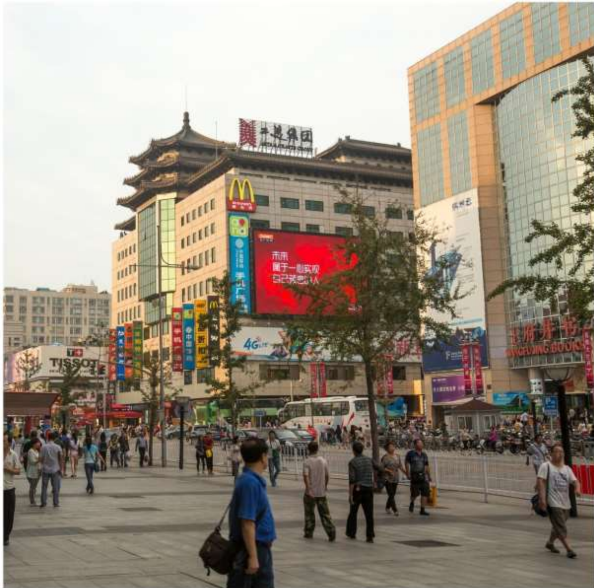
ค่ำ รับประทานอาหารค่ำ ณ ภัตตาคาร หลังจากอาหารนำท่านเดินทางกลับสู่โรงแรมที่พัก JW Marriott Hotel Beijing ระดับ 5 ดาว

นำท่านเดินทางสู่ถนนหวังฝูจิ่ง Wangfujing Street ให้ท่านเพลิดเพลินกับ ถนนช้อปปิ้งชื่อดัง ใจกลางปักกิ่งที่คึกคักที่สุด กับถนนคนเดินที่เต็มไปด้วยร้านค้าแบรนด์ดัง ห้างสรรพสินค้า และสตรีทฟู้ดหลากหลายนัดให้ลองลิ้มรส เดินเล่นท่ามกลางแสงไฟยามค่ำที่สวยงามที่สุดคึกคัก พร้อมเก็บบรรยากาศเมืองใหญ่ที่มีเสน่ห์ทั้งความทันสมัยและวัฒนธรรมจีนดั้งเดิมในที่เดียว จุดหมายที่สายช้อปปิ้งและสายกินห้ามพลาด