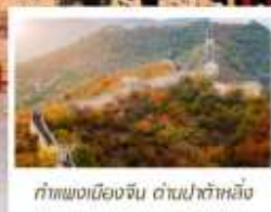
กำแพงเมืองจีน ด้านป่าหิมะ