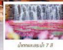
น้ำตกทะเลสาบ 7 สี