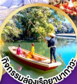
กิจกรรมล่องเรือยามากะ