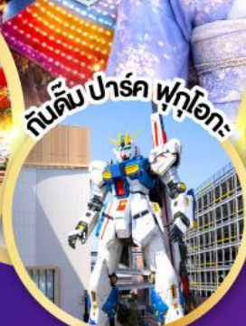
กับดัก ปาร์ค ฟุกุโอกะ