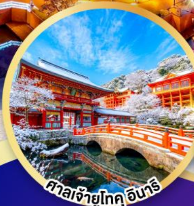
ศาลเจ้าโทคุอินาริ