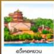
อวี่เหอหยวน

เปิดปักกิ่ง / สุกี่มองโกล มิซซอซิน TAO TAO JU