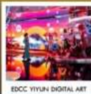
EDCC YIYUN DIGITAL ART