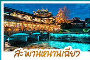
สะพานหนามเด็ยว

เช็กอิน "ภูเขาสี่ฤดู" ชมทิวทัศน์ภูเขาหิมะติดกับผืนป่าสุดอลังการ ชมแสงสีสุดโรแมนติก BLUE TEARS ณ สะพานหนามเด็ยว นั่งรถไฟความเร็วสูง เชื่อม 2 มหานคร เจ็ดตุ - ฉงชิ่ง ถ่ายภาพรถไฟกะลูดี้ แลนด์มาร์กดังแห่งฉงชิ่ง เช็กอินจุดชมวิวยุคใหม่ LIGHT OF COPPER วิวยามค่ำคืนสุดตระการตา