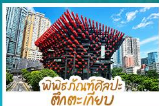
พิพิธภัณฑ์ศิลปะ ฮักตงเก๋ยบ