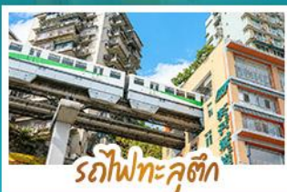
รถไฟกะลูดี้