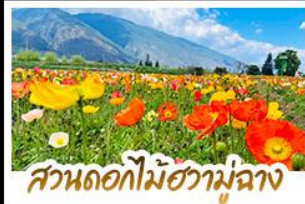
สวนดอกไม้ฮวามู่ฉาง