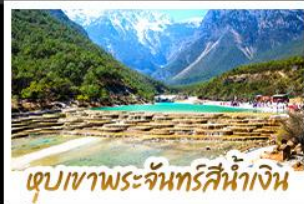
เขุบเขาพระจันทร์สีน้ำเงิน