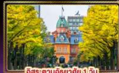
อีสะะ-ตามอริยาตัย 1 วัน