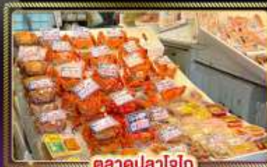
ตลาดปลาโอไก