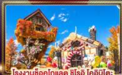
โรงงานช็อคโกแลต ชิโรอิ โคอิบิโคะ