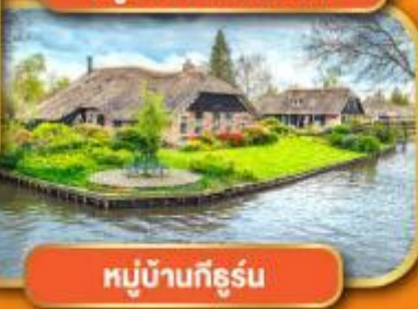
หมู่บ้านก็ธูร์น