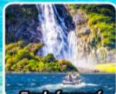
บิลฟอร์ด ซาวด์ นั่งเรือชมความงาม ฟยอร์ด