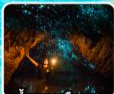
ถ้ำหอนเรืองแสง ไวท์โทโป