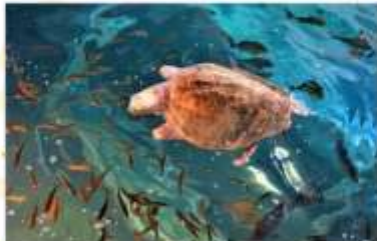
KUSHIMOTO MARINE PARK