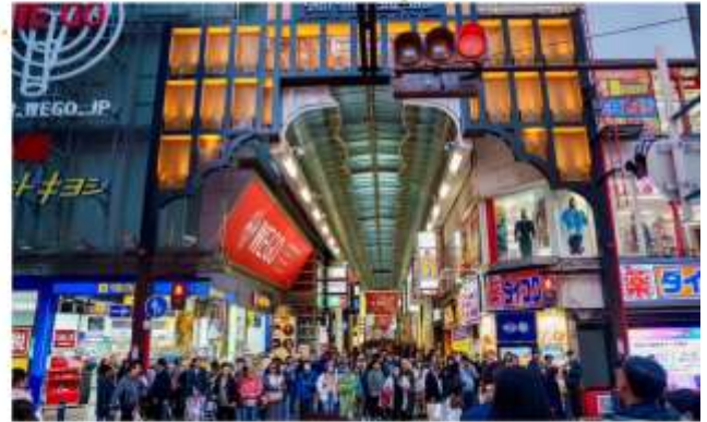
อีสร-อาหารกลางวันตามอียาคิ (ไม่รวมในรายการ)