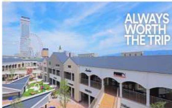
SHOPPING AT RINKU PREMIUM OUTLET