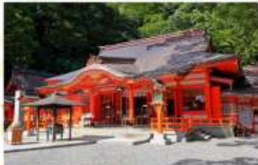
KUMANO NACHI GRAND SHRINE