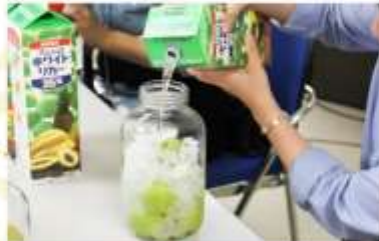
UMESHU MAKING AT NAKANO BC