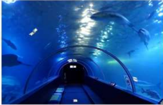
KUSHIMOTO MARINE PARK