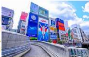
SHOPPING AT SHINSAIBASHI