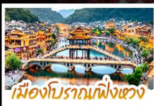
เมืองโบราณกึ่งผาง