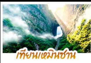
เทียนเหมินชาน

การบันเทิงยามค่ำคืนแบบไม่ลงร้าง • รวม 5 เมืองโบราณชื่อดังไว้ในทริปเดียว ขึ้นเขาอวดคาร์ดด้วยลิฟท์แก้วไปหลง • นั่งกระเช้าพิชิตทำประตูสวรรค์ที่ยืนหมื่นชา เดินท้าความเสียวบนหน้าผากระจก • ล่องเรือชมภาพเขียนแม่น้ำอูเจียง