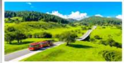
เวนางฟ้า

เดินทางโดย: สายการบินดงซิ่งเจียงเป่ย์ (PN)