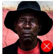
Back side is colored