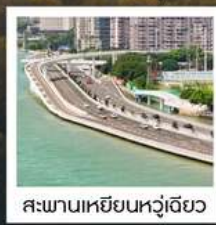
สะพานเหยียนหู่เฉียว

1 ประเทศ 2 ระบบ ในทริปเดียว!! ข้ามทะเลจากจีน...สู่จินเหมิน (ใต้หวัน)