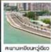
สะพานเหยียนหัวเจียว