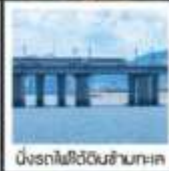
นั่งรถไฟใต้ดินข้ามทะเล