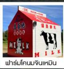
ฟาร์มโคนมจินเหมิน