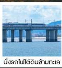
นั่งรถไฟใต้ดินข้ามทะเล