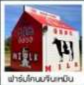
ฟาร์มโคนมจินเหมิน