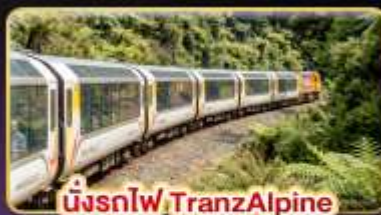
นั่งรถไฟ TranzAlpine