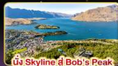
นั่ง Skyline ที่ Bob's Peak