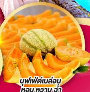
บุฟเฟ่ต์เมล่อน หอมหวานซ่า