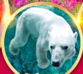
สวนสัตว์อาซาฮิยามะ