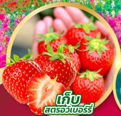
เก็บ สตรอว์เบอร์รี่