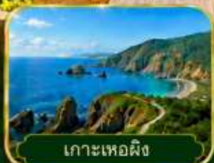
เกาะเหอผิง