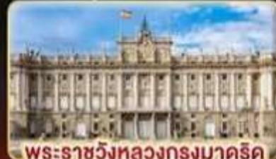
พระราชวังหลวงกรุงมาดริด