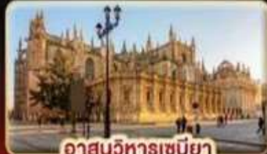
อาสนวิหารเซบิยา