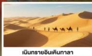
เป็นกรายอินเคินกาลา