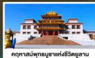
คฤหาสน์พุทธบูชาแห่งชีวิตยูลาน