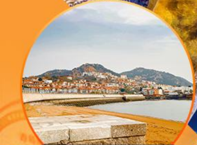
ซาจื่อโข่ว