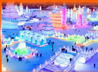
เที่ยว ICE & SNOW WORLD