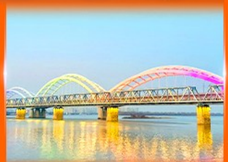
สะพานทโพนินโจว