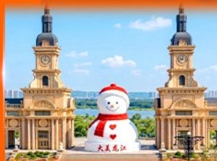
ตุ๊กตาหิมะยักษ์ ฮาร์บิน