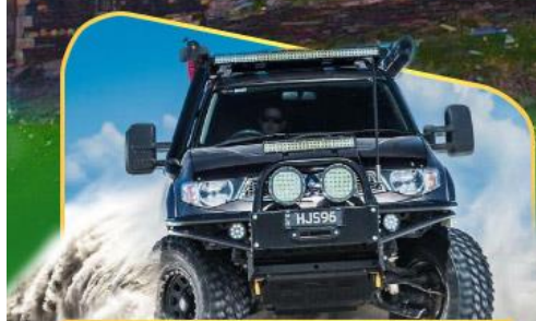
ขึ้นรถ 4WD สู้อีกกลางเทือกเขาคอเคซัส