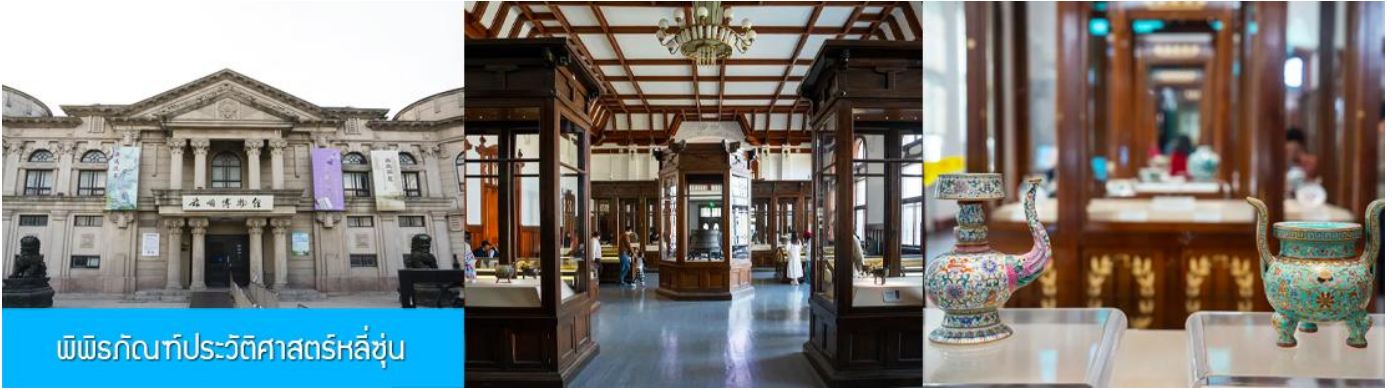
พิพิธภัณฑ์ประวัติศาสตร์หลู่ซุ่น

จากนั้นนำท่านเที่ยวชมและเก็บภาพ ณ พิพิธภัณฑ์ประวัติศาสตร์หลู่ซุ่น 旅顺博物馆 เป็นอาคารพิพิธภัณฑ์เก่าแก่อายุกว่าร้อยปีแห่งแรกที่ยังคงสภาพดั้งเดิมทางภาคตะวันออกเฉียงเหนือของจีน อาคารพิพิธภัณฑ์มีความโดดเด่นด้วยสถาปัตยกรรมแบบกรีกโรมันยุคเรเนซองส์ ผสมผสานสถาปัตยกรรมแบบตะวันออก ภายในมีการจัดแสดงโบราณวัตถุกว่า 60,000 ชิ้น ท่านสามารถเก็บภาพที่ระลึกด้านหน้าอาคารพิพิธภัณฑ์ และสามารถเข้าชมโบราณวัตถุภายในพิพิธภัณฑ์ได้ตามอัธยาศัย (พิพิธภัณฑ์ปิดทุกวันจันทร์)..