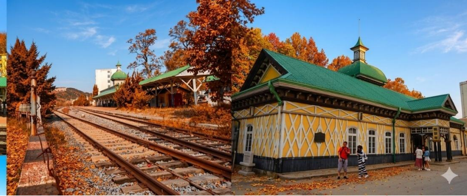
สถานีรถไฟหลี่ซุ่น

นำท่านเที่ยวชมและเก็บภาพ ณ สถานีรถไฟหลี่ซุ่น 旅顺火车站 เป็นสถานีปลายทางของเส้นทางรถไฟสาขา เส้นหยาง - ต้าเหลียน สร้างขึ้นในปีค.ศ. 1903 ออกแบบโดยสถาปนิกชาวรัสเซีย เป็นอาคารอิฐก่อปูนผสม โครงสร้างไม้ตามสถาปัตยกรรมรัสเซีย.