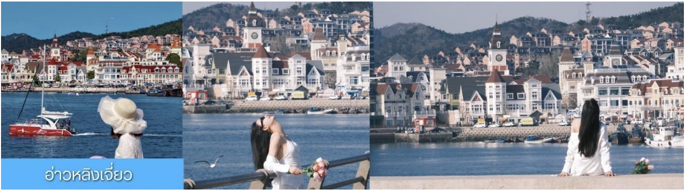
อ่าวหลิงเจี้ยว

จากนั้นนำท่านเที่ยวชม อ่าวหลิงเจี้ยว 菱角湾 เป็นอ่าวธรรมชาติและแลนด์มาร์กถ่ายรูปสุดฮิตในเมืองต้าเหลียน ประเทศจีน โดดเด่นด้วยทิวทัศน์บ้านเรือนสีแสนสดใสเรียงรายริมน้ำ จนได้รับฉายาว่า "Little Santorini แห่งต้าเหลียน" และเป็นจุดชมพระอาทิตย์ตกที่สวยงามมากแห่ง