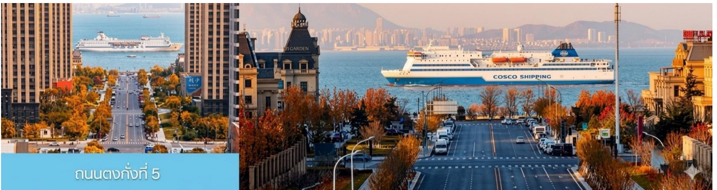
ถนนตงกั๊งที่ 5

จากนั้นนำท่านเที่ยวชม สวนน้ำเมืองเวนิสตะวันออก 大连东方威尼斯城 เป็นเมืองเวนิสจำลองที่ถูกสร้างขึ้นด้วยทุนกว่า 8,000 ล้านบาท ออกแบบโดยบริษัท ARC จากประเทศฝรั่งเศส โดยจำลองผังเมืองเวนิสในประเทศอิตาลี บนพื้นที่กว่า 400,000 ตารางเมตร ประกอบด้วยคลองเวนิสและอาคารที่มีสถาปัตยกรรมแบบตะวันตกกว่า 200 หลัง มีบริการล่องเรือคอนโดล่าแก่นักท่องเที่ยว นำท่านเดินชม ถ่ายภาพที่ระลึกท่ามกลางอาคารสไตล์ยุโรป ตามอัธยาศัย.