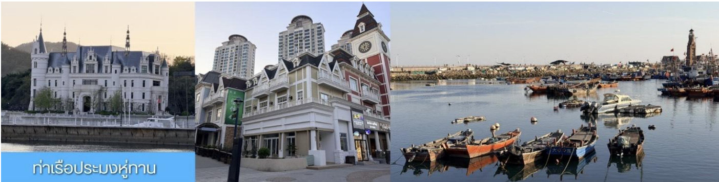
ท่าเรือประมงหู่กาน

พักที่ DALIAN JUZISHUIJING HOTEL หรือ โรงแรมระดับ 4 ดาวท้องถิ่น เมืองต้าเหลียน