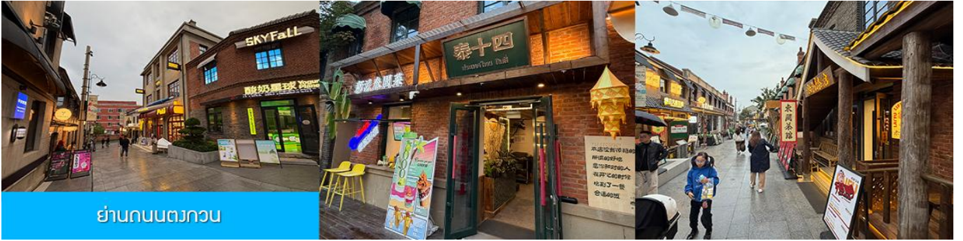
ย่านถนนตวงวน