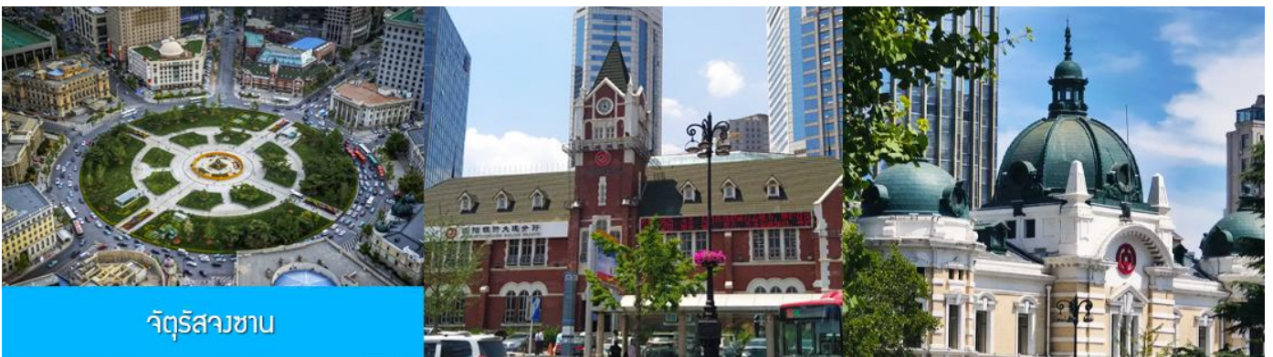
จัตุรัสวงเวียน

จากนั้นนำท่านเที่ยวชม อ่าวหลิงเจี้ยว 菱角湾 เป็นอ่าวธรรมชาติและแลนด์มาร์กถ่ายรูปสุดฮิตในเมืองต้าเหลียน ประเทศจีน โดดเด่นด้วยทิวทัศน์บ้านเรือนสีแสนสดใสเรียงรายริมน้ำ จนได้รับฉายาว่า "Little Santorini แห่งต้าเหลียน" และเป็นจุดชมพระอาทิตย์ตกที่สวยงามมากแห่ง