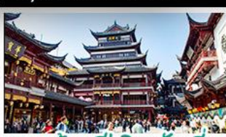
ตลาดร้อยปีเจิ้งหวงเหมียว