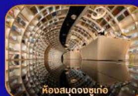
ห้องสมุดจงซูเก้อ