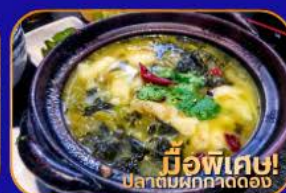
มีพิเศษ! ปลาต้มผักกาดดอง