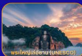
พระใหญ่เล่อซาน (UNESCO)

ล่องเรือชม "พระใหญ่เล่อซาน" - เมืองโบราณหวงหลงซี - แพนด้าเซลฟี - ห้องสมุดจงซูเก้อ - Wangjianglou Park - ถนนชุนซีลู่ (แหล่งช้อปปิ้ง) - IFS (แพนด้าปิ่นตึก) - วัดต้าเจ้อ