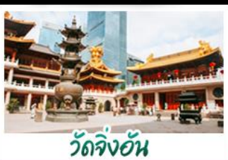
วัดจิ้งอัน