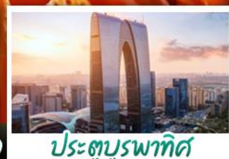
ประตูบูรพาทิศ