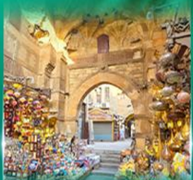
ตลาดท่านเอลกาลลี