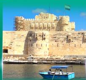
บอมปรการ Quite Bay