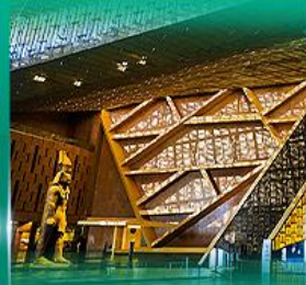
พิพิธภัณฑ์แกรนด์อียิปต์ (GEM)