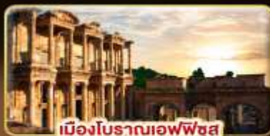
เมืองโบราณเอฟเฟซ