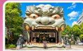
ศาลเจ้านัมมะ ยาชากะ