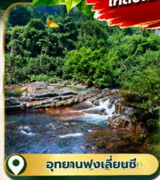
อุทยานฟ่งเลี่ยนซี