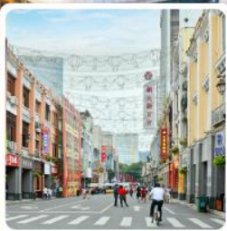
ถนนคนเดินเป่ย์จิงลู่