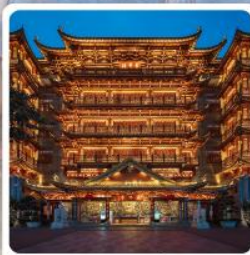
วัดต้าฝื่อซื่อ