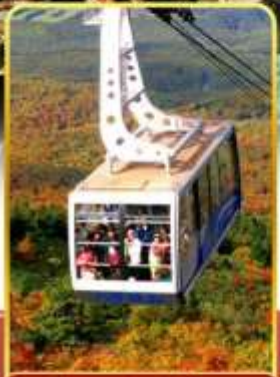
นั่งกระเช้าอิกโกดะ