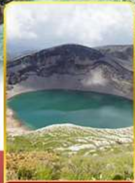
ปากปล่องภูเขาไฟซาโอ