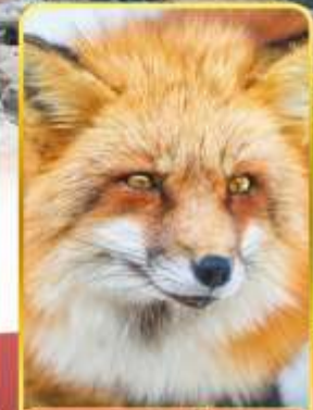
ฟาร์มสุนัขจิ้งจอก