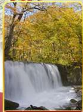
ลำธารโออิราสะ