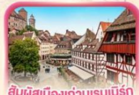
สัมผัสเมืองเก่าบูเรมเบิร์ก