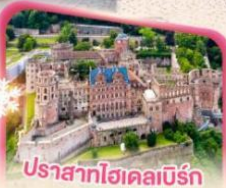
ปราสาทไฮเคลมเบิร์ก