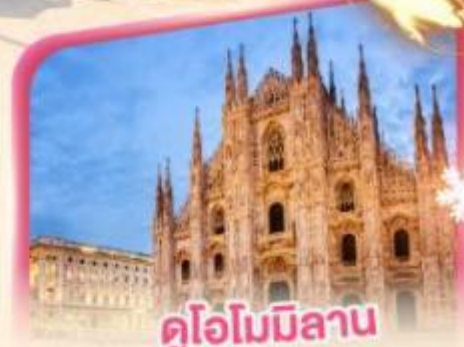
ดูไอโมมิซาน