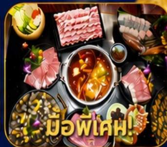
บุฟเฟ่ต์ชาบูสโตร์ฮ่องกง