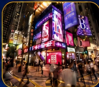
ซอปปิงซินชาฮุย

วัดเจ้าแม่กวนอิมฮ่องกง - ซอปปิงซินชาฮุย - วัดนาจา วัดแชกงหมิว - วัดหวังต้าเซียน