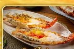
กุ้งแม่น้ำย่าง