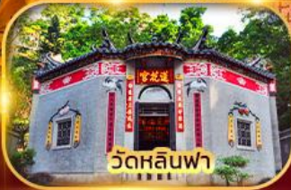
วัดหลินฟา