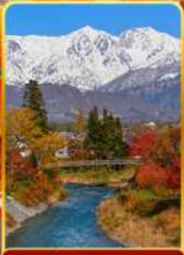
โออิเดะพาร์ค