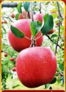
กิจกรรมเก็บแอปเปิ้ล