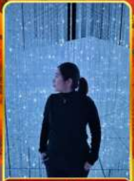
ทีมแลบโตเกียว