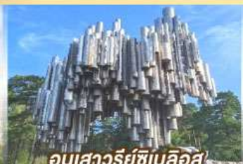
อนุสาวรีย์ซีเบลึอุส