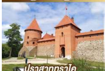
ปราสาททราโค