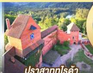
ปราสาทกูไรต้า