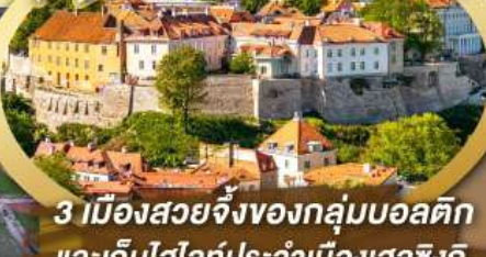
3 เมืองสวยจิ้งของกลุ่มบอลติก และเก็บไฮไลท์ประจำเมืองเอสซิงกี และล่องเรือเฟอร์รี่ข้ามประเทศ

ไฮไลท์ในโปรแกรม • เที่ยวสามประเทศหลักกลุ่มบอลติก • ชมเมืองหลวงวิลนิอุส ประเทศลัตเวีย